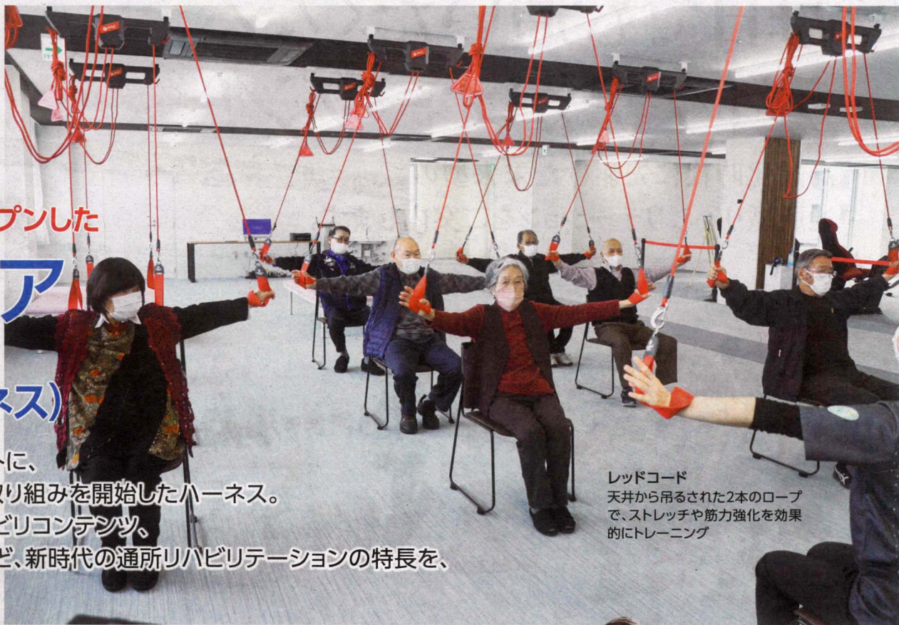
レッドコード 天井から吊るされた2本のロープで、ストレッチや筋力強化を効果的にトレーニング

そんな中、地域における高齢者の医療・介護に取り組む西山病院グループでは、1981年の創設当初から、気持ちのわかる親切・なごやかな雰囲気・清潔という3つの理念を掲げ、ご利用者やご家族の意向に沿ったケアを実践。入院・入所から通所・訪問などのサービス