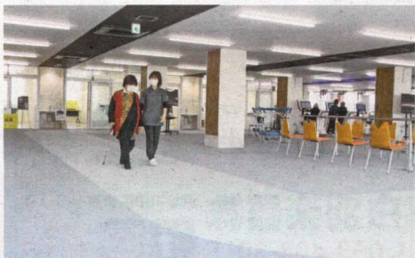
75m歩行トラック 1周75mの歩行訓練用トラック。室内にあるので、季節や天候に左右されることなく行える