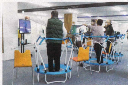
ケアトランポリン 高齢者用に設計されたトランポリン。上下運動を楽しみながら、脳トレ&筋トレを!