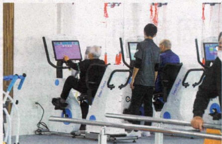
コグニバイク 自転車型のリハビリ機器で、認知機能のトレーニングを安全に、効果的に、楽しく実施