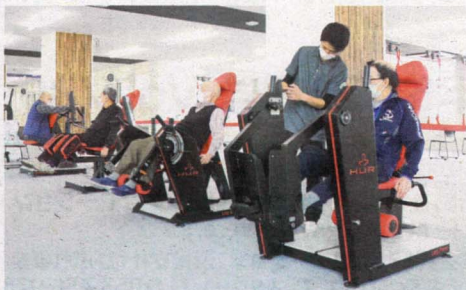
HUR パワーリハビリ 最新テクノロジーを駆使した空圧式筋力トレーニングマシン「HUR(フー)」